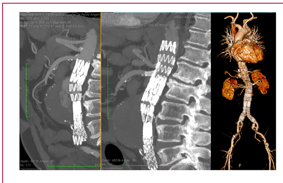
Fig. 1. De izquierda a derecha. Imagen tomográfica antes y después de colocada la endoprótesis fenestrada por endoleak tipo IA. A la derecha, reconstrucción 3D de la endoprótesis fenestrada

Por lo que sabemos, estos hallazgos no se han comunicado anteriormente. Aunque se trata del reporte de un caso, acompañado en nuestra experiencia de una